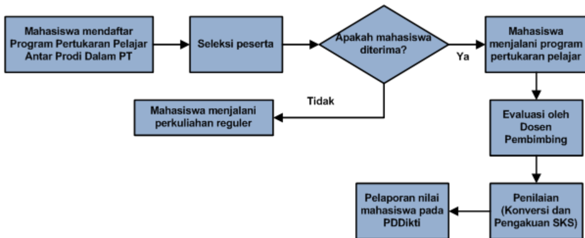
Gambar 2. Ketentuan Pelaksanaan Program Pertukaran Pelajar Antar Prodi Dalam PT